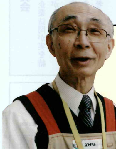
(スーパー売り場整理)

買い物客で混み合う時 間帯は、俄然、忙しくな りますね。カートやカゴの 回収・整理などお客様や レジ係・店員さんのスム ーズな流れが保たれるよ うに気配りしています。