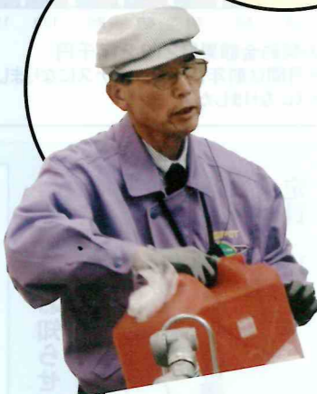
(スーパー灯油売り場)

前の経歴で取得した「危険物取扱 者免許」を生かした仕事です。灯 油販売のない時は、コーナ―の整 理などを4人で担当しています。