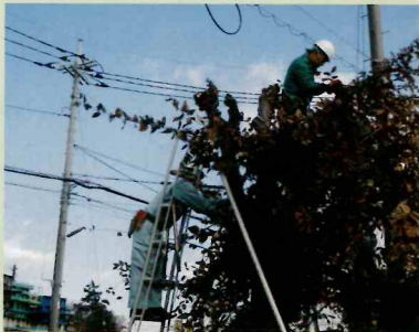
高所作業をする際は安全帯を取付け、足場の安全を確認するようしていました

伊勢原市環境美化センター 簡易な植木の手入れ・刈込作業など、植木管理の基礎知識を取得する為の講習会でした。