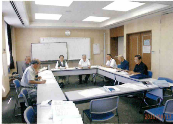
専門部会長会議風景

中長期計画の大きな柱として実施した就業に関する意向調査も9月までに10回の部門長会議で集計と分析が行われ、検討段階に入っています。今後、数回の討議を経て、分析データを基に、ワークシェアリングに対する具体的な方向付けをすべく取り組んで行きます。 アンケート調査のその他ご意見の集計結果につきましては多数意見を下欄に表組掲載しました。 なお、9月度会議からは就業年数制限・年齢制限についても具体的な検討に入り、年度内には要綱を作成する予定です。