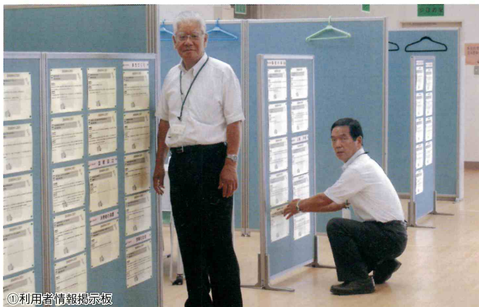
①利用者情報掲示板