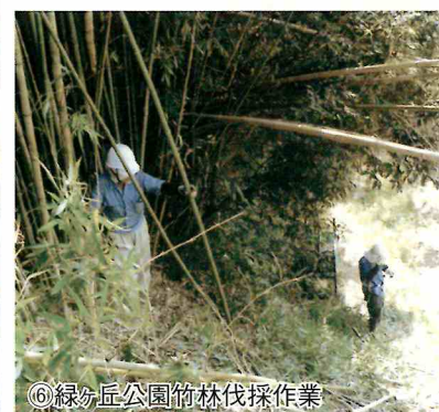
⑥緑ヶ丘公園竹林伐採作業