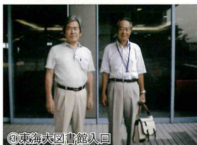
③東海大学図書館入口