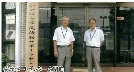
②サポートセンター玄関前