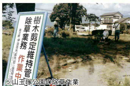
⑤山王塚公園の除草作業