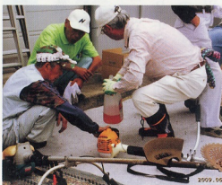
刈払い機準備作業