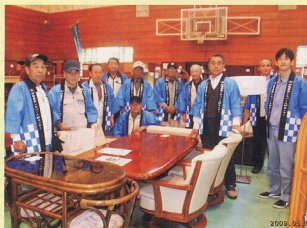
リサイクル班及びスタッフ一同

開催日 H21.5.9(土)・10(日) 開催場所 市体育館で公園緑花まつりと同時開催 売上点数 272点