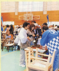
開場直後の盛況ぶり