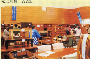
大型家具も展示されている会場