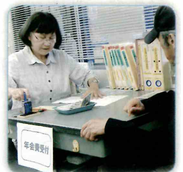
年会費受付 センター窓口にて