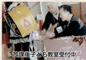
放課後子ども教室受付中