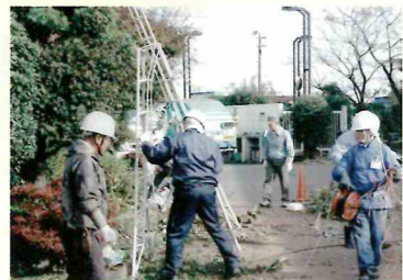
11/27 植木剪定講習会 参加14人