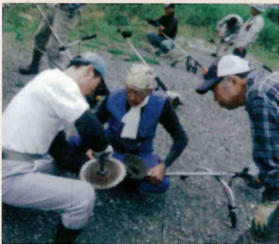
学び合う刈払機講習会