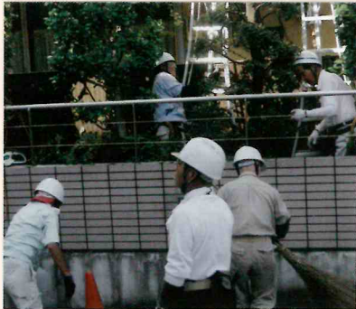
「共働 共助」 植木剪定作業