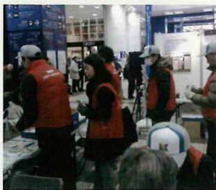
「そごう広場」相談コーナー

横浜「そごう」前広場で県下12シ ルバー人材センターが参加し日頃の活動を通行客に紹介しました。