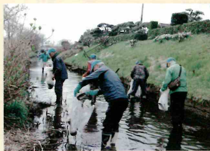
3/29、芝桜ボランティア

年3回の連絡員会議で会員の情報収集とコミュニケーションを図っています。シーズンになるとボランティア活動として、渋田川、歌川の清掃、芝桜やあやめまつりの際の草刈りや駐車場の管理をしています。