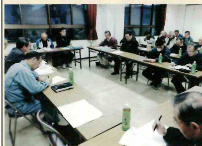
3/11、大山・高部屋班総会