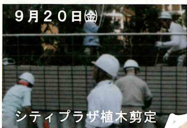
シティプラザ植木剪定

恒例となったシティプラザの樹木の剪定作業が行われました。(20人が参加)市民の方からねぎらいの言葉がありました。