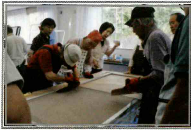
真剣に、中にはメモを取る人も。

修了した参加者は、「これでやり方が分かりました」「今度こそ自分で襖張りに挑戦してみようと思います」など口々に感想を