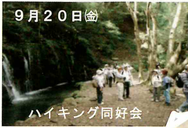
ハイキング同好会