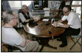
『月刊シルバー人材センター』