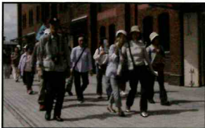
ハイキング同好会