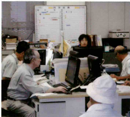
迅速・正確をモットーに

※提出する自分の「就業報告書」の内容(契約内容・金額・計算・認印)は、自分で必ず確かめよう。