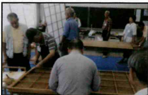
襖・障子張り講習会