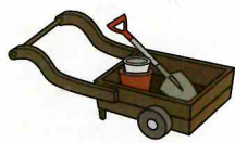
事前の下見も大切です