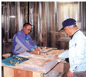
サンプルを貼り付ける会員 (取材/会員 渡辺勝久)

外壁や内装の建材類を展示用サンプルに加工している会社である。材質や色、用途別の大小各種を注文に応じてベニア板上に一つひとつ丁寧に貼り付けていく作業である。そうした貼り付けの仕事以外にも、ベニア板切断・塗装・梱包などの部門を