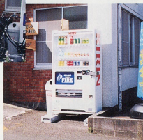
自動販売機もご利用下さい