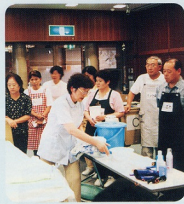
ホームヘルパー2級講座 介護実習風景