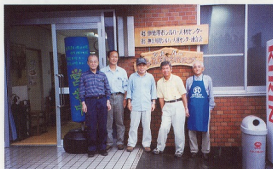
ふれあいショップは、シルバー会員がスタッフとして運営にあっています