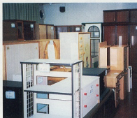
安くても良い物がありますよ!