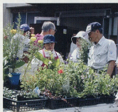
季節の草花・野菜も販売しています