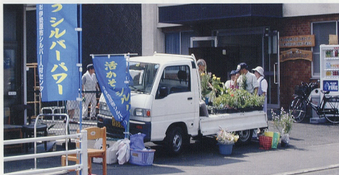
ふれあいショップ風景