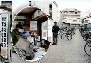
⑦ 北口第3・5自転車駐車場

コロナの影響で授業が休講の為、大学生の利用者が少なくなってきたというのですが、中学生、高校生は多くなっているとのことでした。