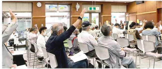
議案を満場一致で可決

令和5年度の主な取り組みとしては、センター活性化として会員の増強、受注の拡大などを推進していく、また、より快適なセンター生活の実現として、ネットを活用した会員への情報提供を進めることなどが示されました。