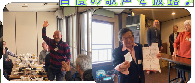
何をゲットしたのでしょうか♪