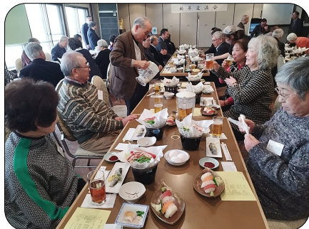
初めましての方ともすぐ打ち解けましたね!

令和6年1月21日(日)、新年交流会が43名(会員38名、来賓5名)参加のもと茨戸ガーデン・ノースヒルにて開催されました。コロナ禍を経て実に4年ぶりに集まれたためでしょうか、皆さんこれまで以上に楽しく過ごされているように感じました。それぞれの特技を披露したり、カラオケに興じたり、音楽に合わせてダンスが始まったりと、和やかな時間が流れました。マジックショーやお楽しみ抽選会で盛り上がり、素敵な思い出がまた増えました!