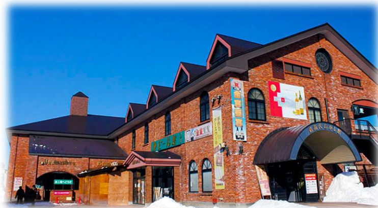
猪苗代ビール醸造所 INAWASHIRO ORIGINAL BEER BREWERY

8:00 8:35~8:50 10:30~10:45 石岡 石岡小美玉IC = 友部SA(合流・休憩) = 阿武隈高原SA(休憩) = 磐梯熱海IC 11:15~13:15 13:45~14:30 14:40~15:10 ホテル華の湯(昼食) 猪苗代地ビール館(買い物) 道の駅猪苗代(買い物) 16:00~16:15 17:55~18:15 19:00頃 阿武隈高原SA(休憩) 友部SA(休憩) 石岡小美玉IC - 石岡