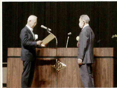
大 類 進 行 会 員