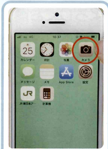
②スマートフォンのトップ画面からカメラアイコンを選択