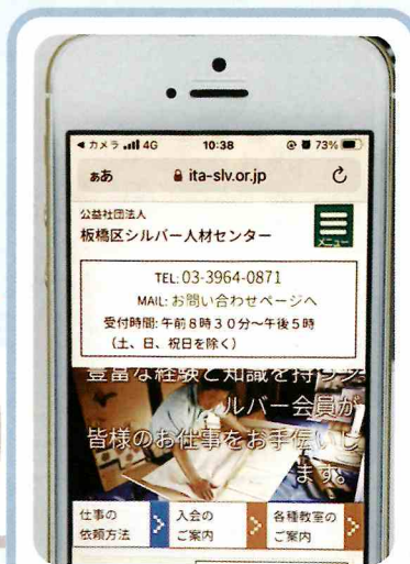
⑤目的の画面になれば完了