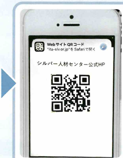
④カメラの撮影機能で、出てくるアドレス (ita-slv.or.jp) を指で触る(選択) ※QRコードにピントを合わせる