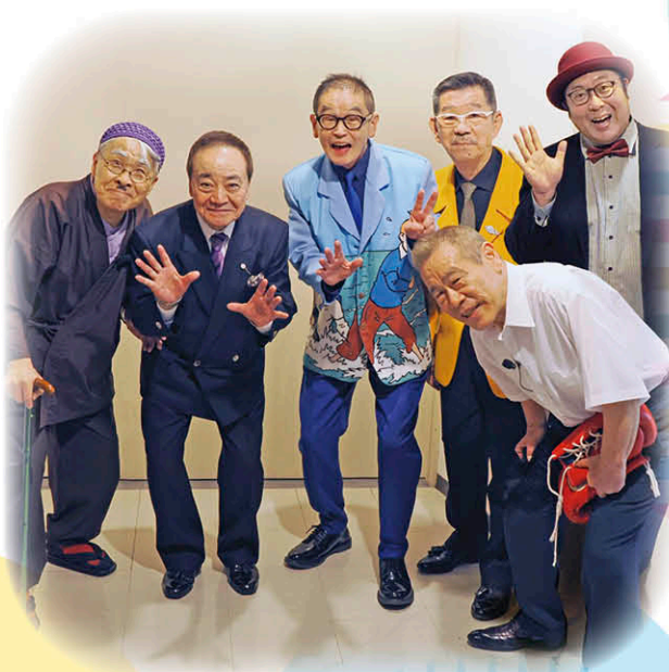
第二部で演芸をされた芸人の皆様

※今回のイベントに興味を持っていただきせっかくお申込みいただいたにもかかわらず、抽選に漏れてしまいイベントに参加できなかった会員の皆様、誠に申し訳ございませんでした。当センターは今後も、社会的価値を高める取組として様々なイベントを企画してまいります。なお、イベント開催の折には改めて会報誌『生きいき』にてご案内させていただきます。