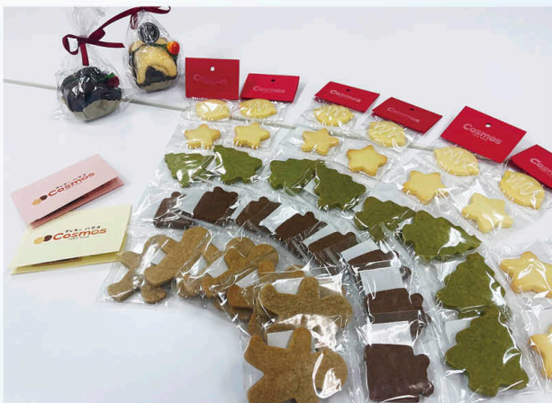
Cosmos提供のクッキーと記念品

二つの講演が終わり、第二部に移る前に休憩に入りました。休憩中は、同会場別フロアにおいて“社会福祉法人にりん草クッキーハウスCosmos”によるクリスマスにちなんだアソートクッキーを提供しました。クッキーの提供は、区内障害者施設とセンターのコラボレーションにより、板橋区のさらなる福祉充実を実現したいという職員の思いが詰まったアイデアです。なお、試食された皆様からの評価は好評で、「おいしい」という声が多く聞かれていました。