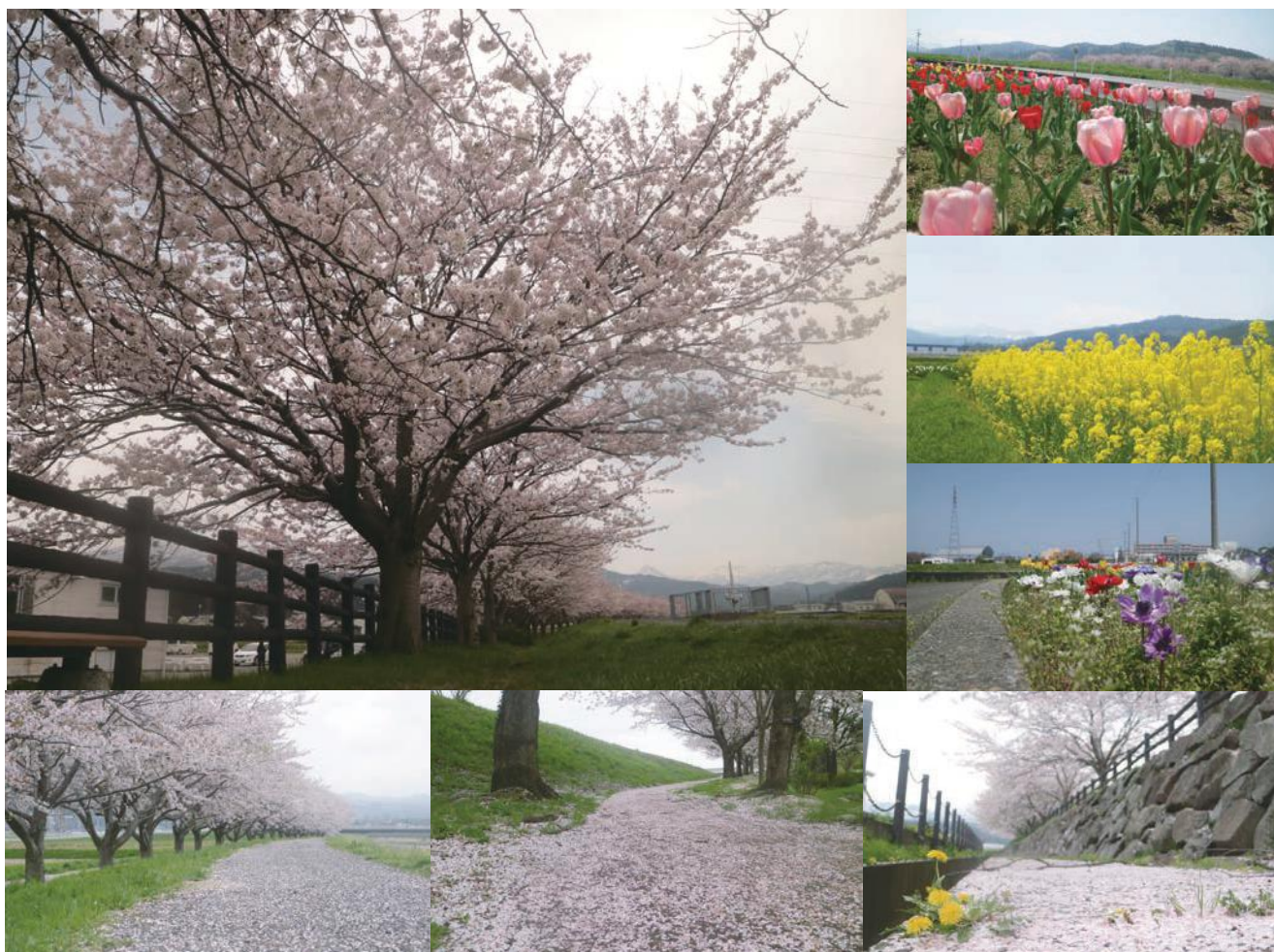
(センター本所周辺)