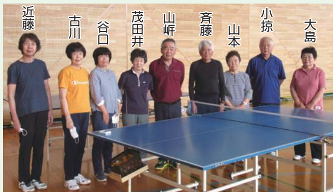
卓球クラブのみなさん (敬称略)