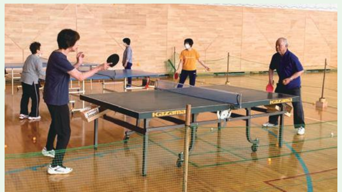
熱いラリーが続く練習風景