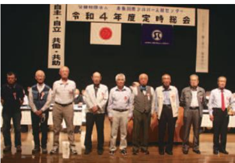
(10年以上の在会、5年以上就業、顕彰規定による)