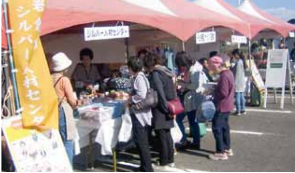
※ふれ愛まつりのテントの様子

岩倉市市民ふれ愛まつりが十一月十日、十一日の両日行われ、当センターの自主事業であるリサイクルショップ日和が子供用品のリサイクルショップを出店しました。今年、二日間とも好天に恵まれ、人も多く売上げも好調でした。