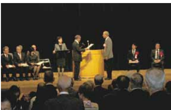
※写真は、ウィルあいちで行われた表彰式の様子