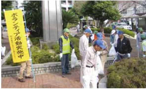
※岩倉駅西広場での様子

全国シルバー人材センター事業協会は毎年十月をシルバー人材センター事業普及啓発促進月間と定め、その第三土曜日を「シルバーの日」として推奨しています。これを受けて当センターは毎年十月の第三土曜日にボラ