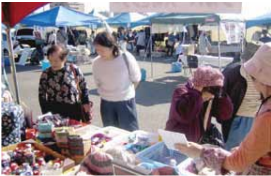
※販売品を品定めする来場者

岩倉市市民ふれ愛まつりが十一月十日、十一日の両日行われ、当センターの自主事業であるリサイクルショップ日和が子供用品のリサイクルショップを出店しました。今年、二日間とも好天に恵まれ、人も多く売上げも好調でした。