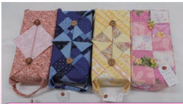
ティッシュボックスカバー 各¥1,300