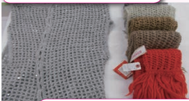
スパンコールベスト ¥8,000