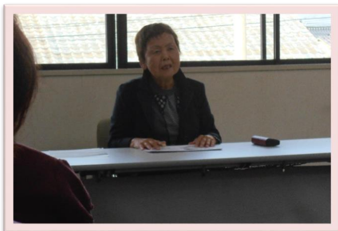
12/4 ミニ講座 ミニクリスマス会開催