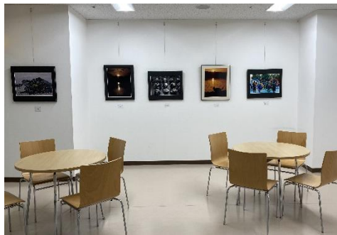
さくらアートギャラリー=かが交流プラザ 加賀市大聖寺八間道 65

かが交流プラザさくら一階に、写真や書、クラフト作品などが展示できる空間ができました。同館の指定管理者である加賀市シルバー人材センターが改装したものです。市民の展示使用は無料で、随時作品を入れ替えながら、地域の交流と市民の文化活動に貢献します。