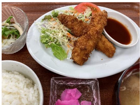
人気の日替りランチ。旬の食材を用いて、あつあつ出来たてで提供。(写真はとび魚フライ)

「レストランさくらで食事をするようになって早7年。仕事で都合が悪い日以外は、ほとんど来ています。それでも飽きないのは、お店の方々や小鉢、味噌汁にまで愛情を感じる事、こんな素敵なお店に感謝です。」