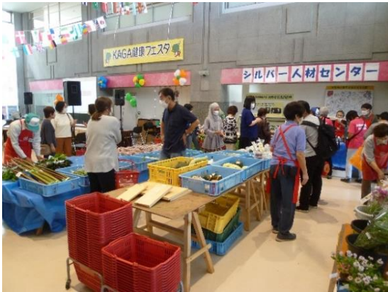
KAGA 健康フェスタでのシルバー人材センターのブース=2022年10月