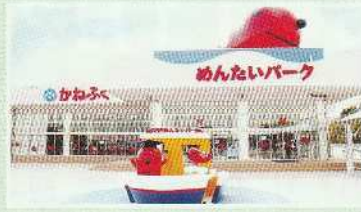
かねふくめんたいパーク