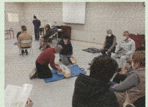
令和5年度 普通救命講習会の様子