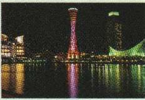
神戸ポートタワー