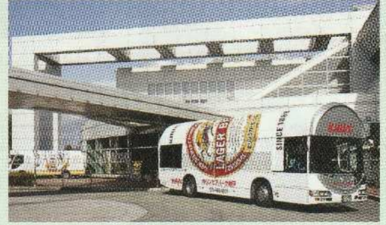
麒麟ビール神戸工場