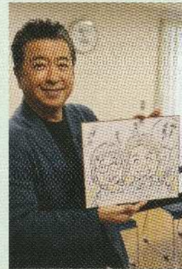
令和6年11月20日(水) 撮影風景 ~老人保健施設 恵友サザンホーム~