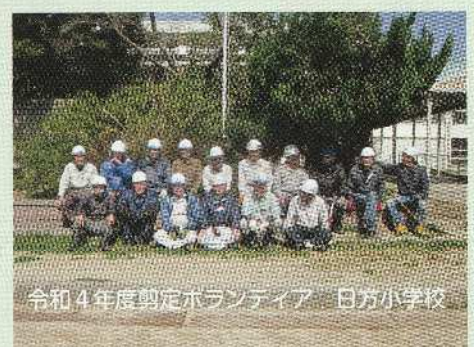
令和4年度剪定ボランティア 日方小学校

※ ボランティアに参加される方は、事前に事務所まで電話でご連絡ください。詳細につきましては、その時ご説明します。