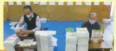
広報かけがわ発送作業