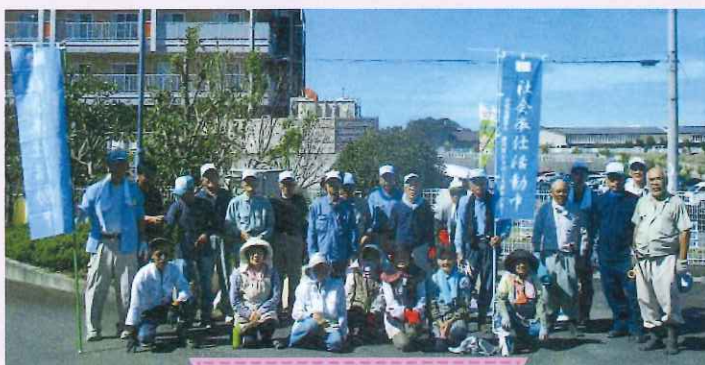
子育てセンター ひだまり