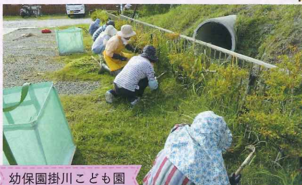
幼保園掛川こども園