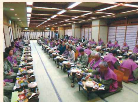
小浜ホテルでのお楽しみ豪華夕食