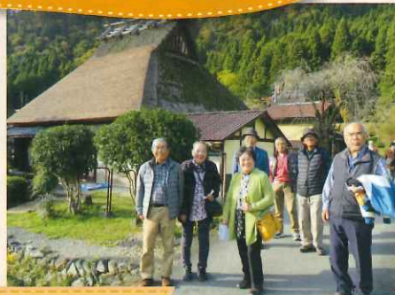
京都美山かやぶきの里