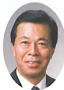
掛川市長 松井三郎