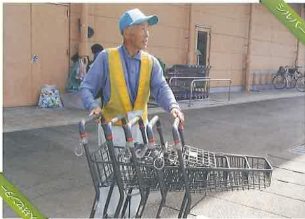
スーパーでのカート移動とリサイクル片付作業