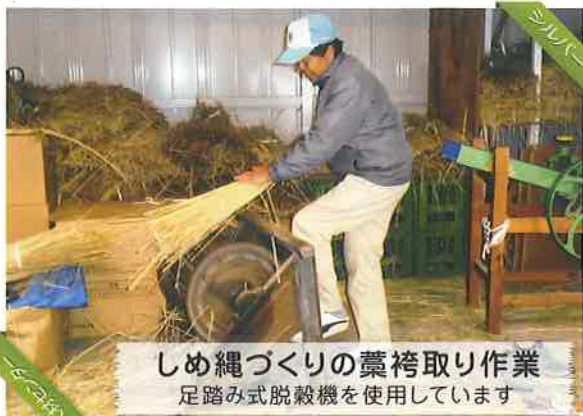
しめ縄づくりの藁袴取り作業 足踏み式脱穀機を使用しています