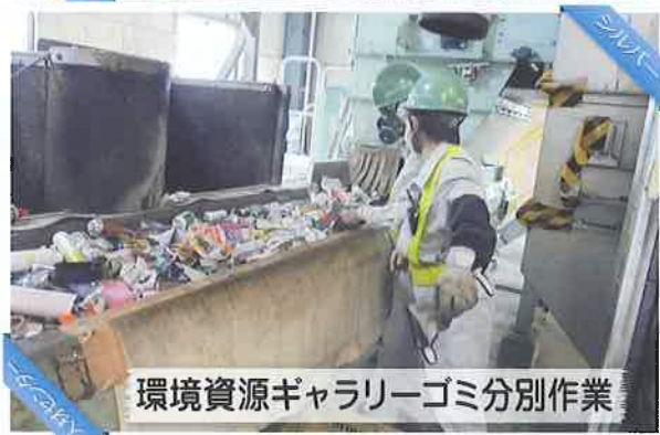
環境資源ギャラリーゴミ分別作業