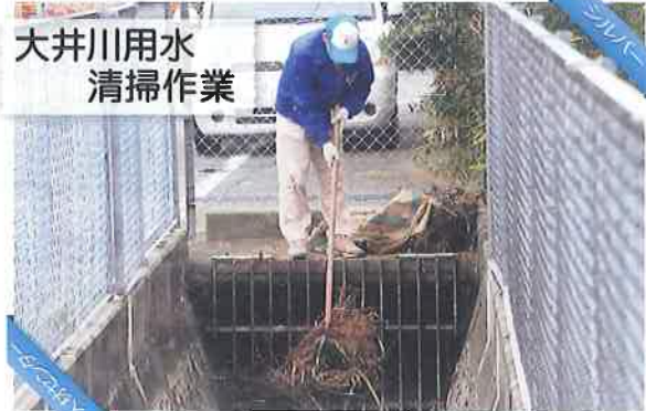
大井川用水 清掃作業