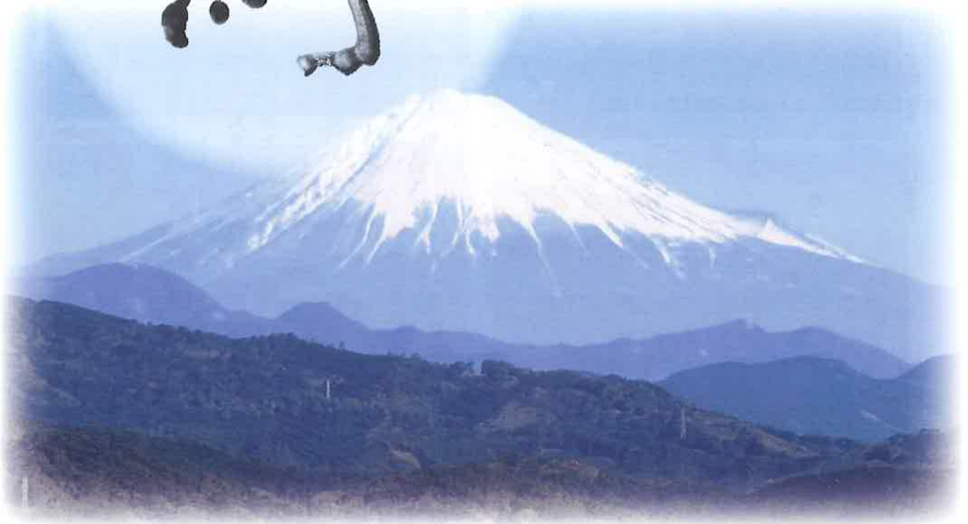
静岡市より富士を望む