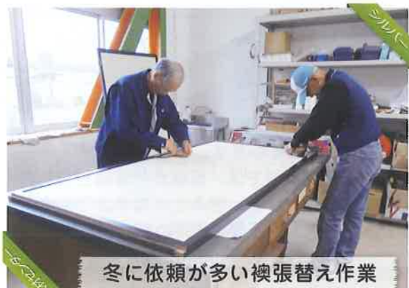
冬に依頼が多い襖張替え作業