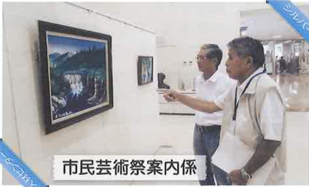
市民芸術祭案内係