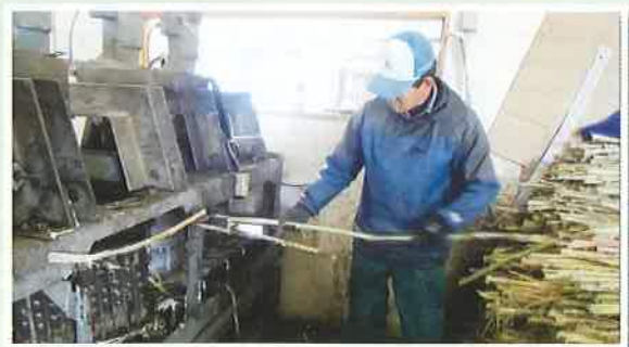
サトウキビを絞って遠州の秘伝糖(よこすかしろ)を作ります 掛川市横須賀にて