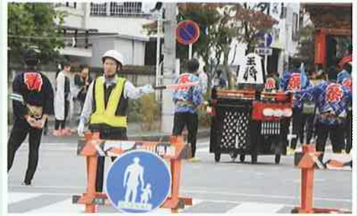
4日間お疲れ様です！掛川大祭交通規制業務