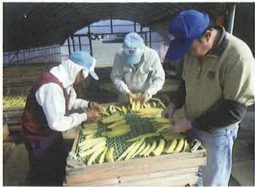
冬の定番、芋切干し作業 掛川市南部農家にて