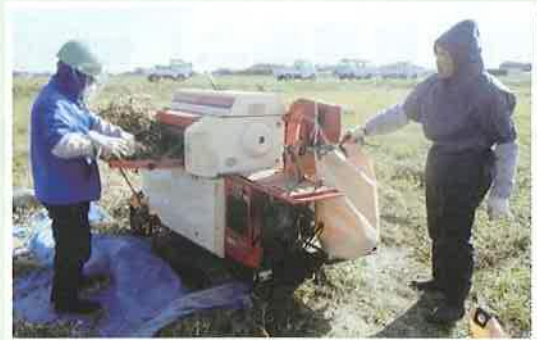
大掛かりな大豆脱穀作業 掛川市南部農家にて