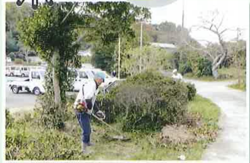
シルバーのPRを兼ねて 幼保園での社会奉仕活動