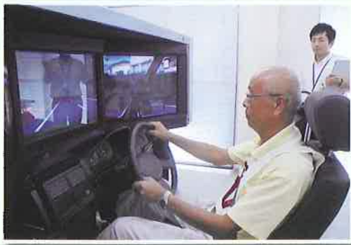
真剣な眼差しの受講者 高齢者運転技術講習会にて