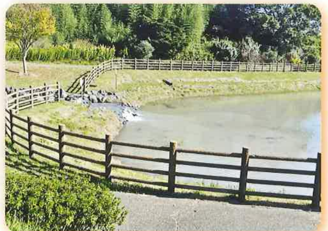
散策を楽しむことができる遊歩道