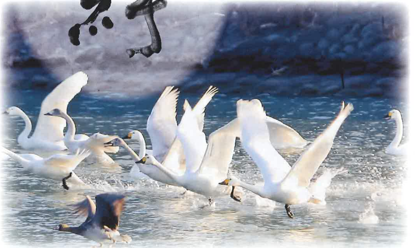
居沼池のコハクチョウ 仲間に入れて? 掛川市大坂