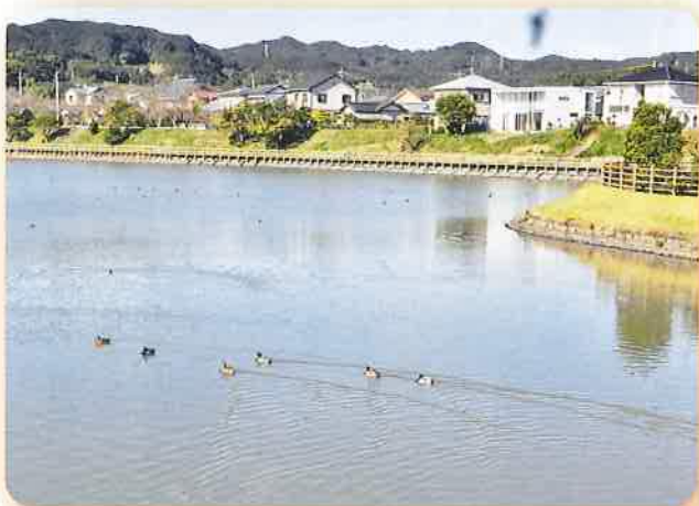
渡り鳥が飛来する居沼池