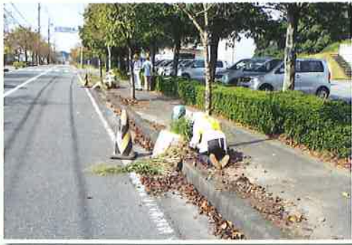
危険が伴う街路の草取り作業に 安全パトロールの厳しい目が光る