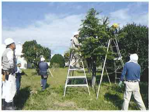
好評の一般市民対象剪定講習会