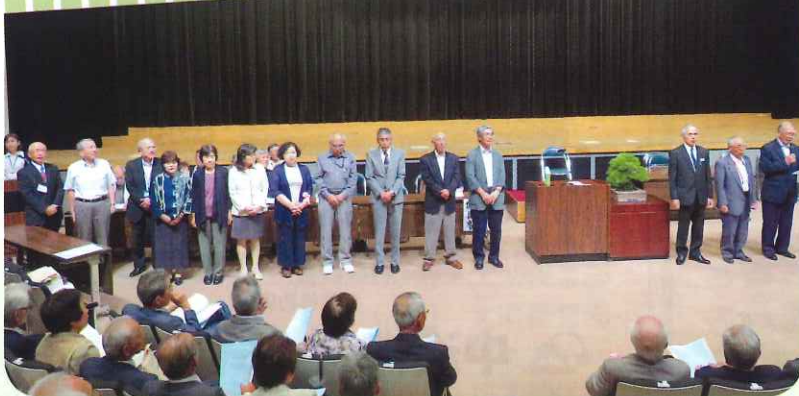
総会で承認された新理事・監事・参与の皆様