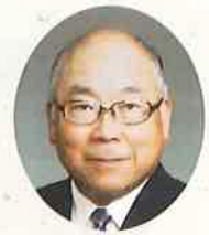
飲む人よりも配る人