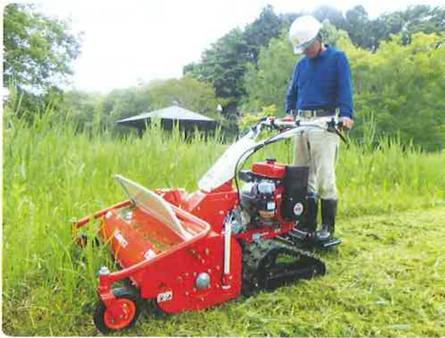
自走式草刈機ハンマーナイフモア

使用者は事前に決められた作業以外は使用することが出来ません。使用時は自走式草刈機安全使用基準事項を必ず厳守し、安全就業第一を心掛けて頂きたい。以上草刈作業の強い味方に関する紹介でした。