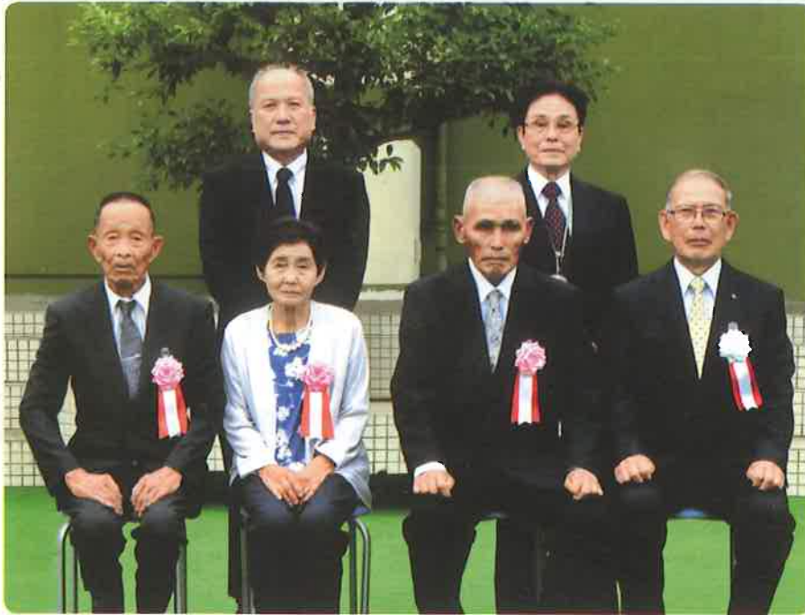
〈後列〉左から 杉山事務局長 藤田前副理事長