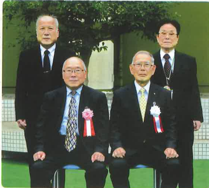
〈後列〉左から 杉山事務局長 藤田前副理事長