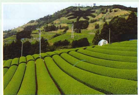
「東山より栗が岳を望む」古池貞夫（城北）