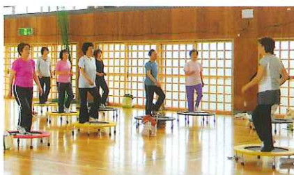
トランポリンとエアロピクスをミックスしたフィットネスのトランポピクス