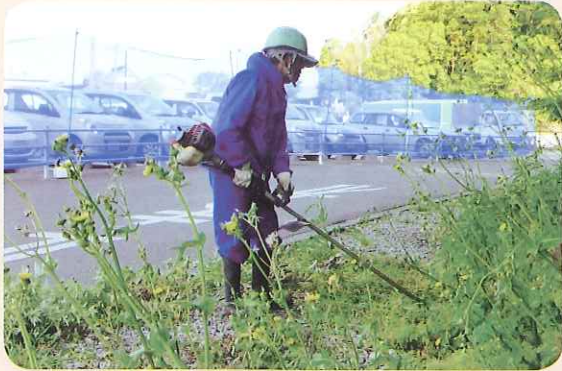
飛石防止ネットを使用しての草刈作業