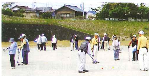
大勢の利用者でにぎわうグラウンドゴルフ

当施設は管理状態が良く、用具等の要望に対しても対応が早く感謝申し上げます。『マナーとエチケット』が活動指針ですので、使用後は全員でグラウンド整備を実施しています。