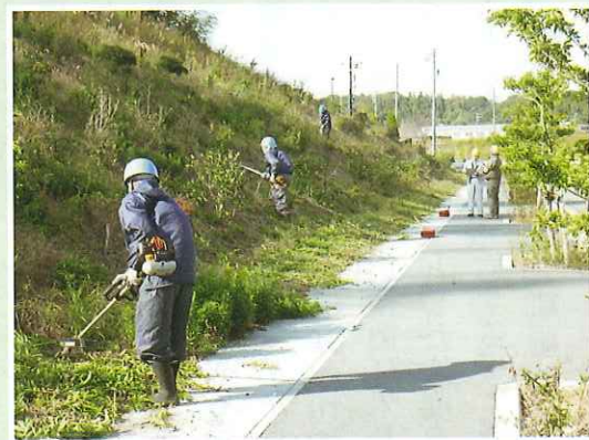
草刈り現場の安全パトロール 厳しいチェックが入ります。