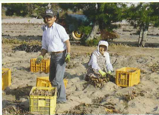
サトイモの収穫作業に従事する会員 砂地での作業は大変です。