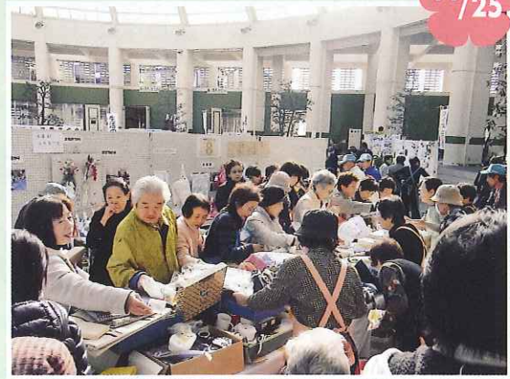
消費生活展で毎年恒例の女性部によるバザー