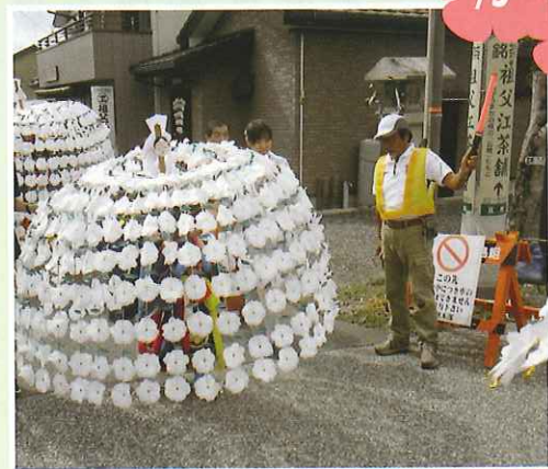
掛川大祭 かんからまち稚児による花笠 のお通りです。右ヨシ！左ヨシ！ どうぞ。