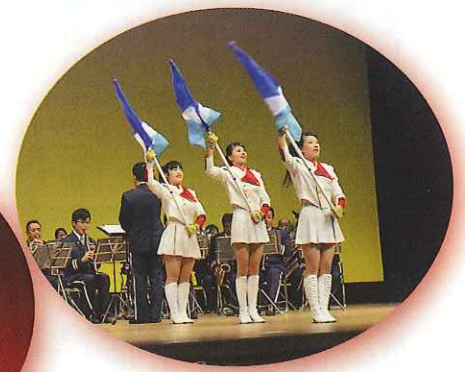
静岡県警察音楽隊の演奏と カラーガードの演技