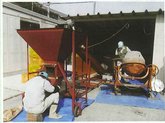
腐葉土を必要量袋に詰める機械 以前の手作業より随分楽になりました。