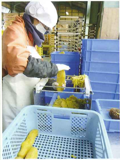
芋切干しの作業 サツマイモを蒸かして熱いうちに皮をむき、ピアノ線を張った器具を使用し、突いて薄くスライスします。