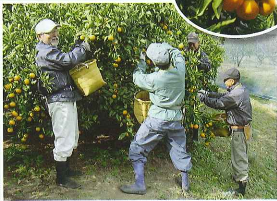
果樹公園の果実収穫作業 おいしそうなミカンがたくさん獲れました。