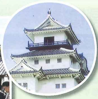
掛川城を視察に見えた尾張旭市のシルバーの皆さんに説明する担当会員