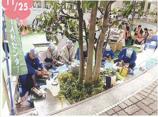
消費生活展の刃物研ぎ作業 今年も大盛況でした。