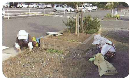
駐車場への進入車両や通過車両に注意しての草取り作業