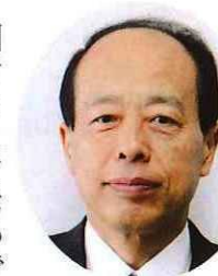
監事 (掛川市副市長) 伊村義孝