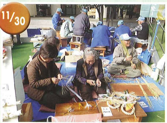
消費生活展 注連縄飾りのデモンストレーションを行いました。 藁の原型と水引の鶴を作製する様子を熱 心に見学されるお客様もいらっしゃいました。 掛川市生涯学習センターにて