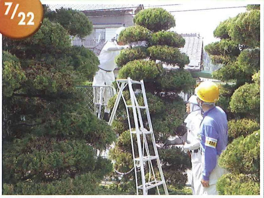
安全パトロール 安全基準に適合していますか。 厳しい目が光ります。