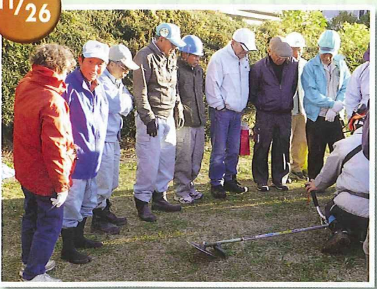
草刈り刈払機講習会 講師の説明を熱心に聞く会員 掛川市生涯学習センターにて