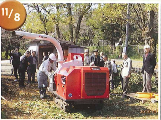
役員視察研修 剪定枝葉リサイクル事業先進地の美濃加茂市 シルバーに17名で行ってきました。