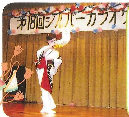
妖艶なお色気の女性？ いいえ、れっきとした男性です。

六十三歳から舞踊を始め早三年。きつかけは区の「いきいきサロン」を担当し、間近で舞踊を見て華麗な踊りに感動し、自分もやろうと決め、踊りとは全