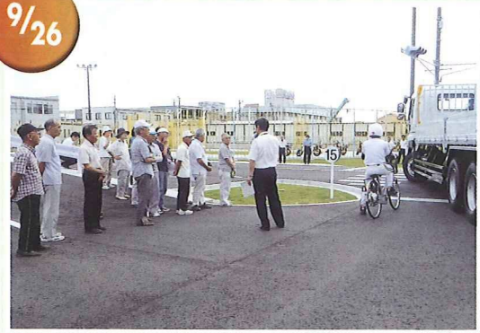
高齢者運転技術講習会 会員20名が参加し、運転技術等厳しい審査 でしたが、全員合格しました。 掛川自動車学校にて