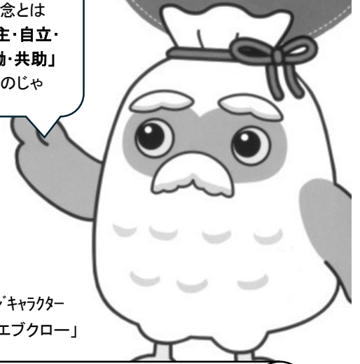
イメージキャラクター 「チエブクロー」