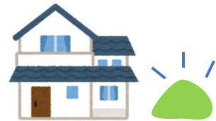
例、自宅庭の一角に集積