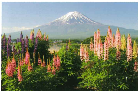
河口湖 大石公園 5月