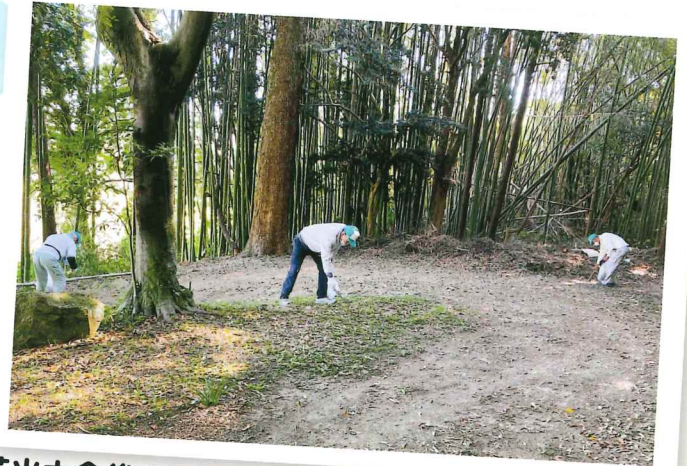
花火大会後の清掃作業