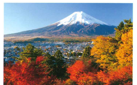
浅間公園 新倉山忠霊塔 11月