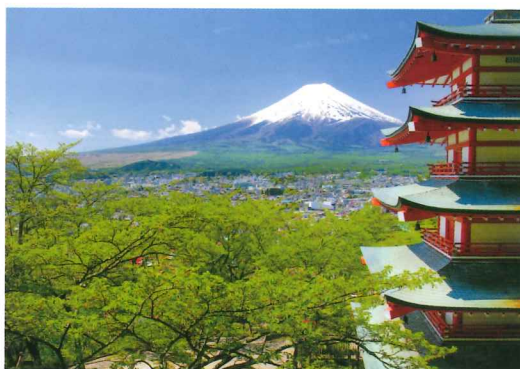
浅間公園 新倉山忠霊塔 5月