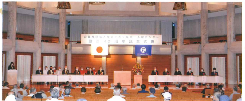
アラベスクホールにて