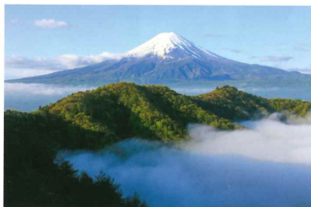
河口湖 西川林道 11月