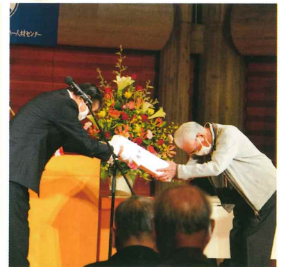
喜寿・米寿のお祝い