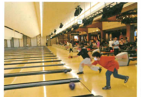
親睦ボウリング大会