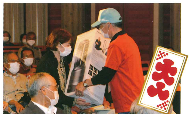
最後に抽選で豪華賞品をプレゼント