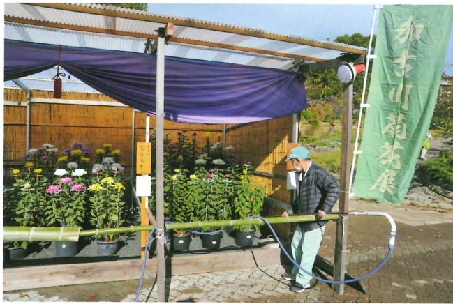
菊花展 菊の水やり