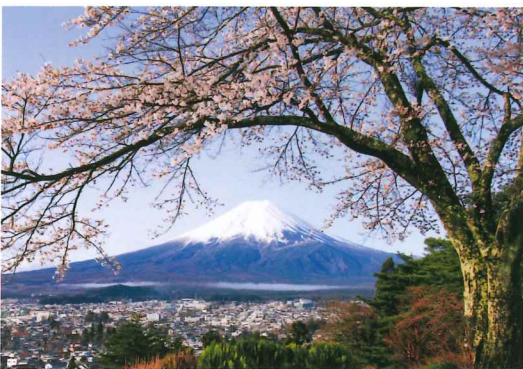
富士吉田 浅間公園 4月