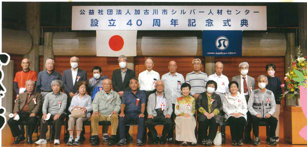
表彰を受けられた会員の皆様