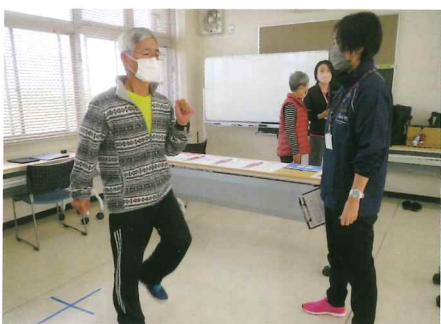
身体の衰え度チェック