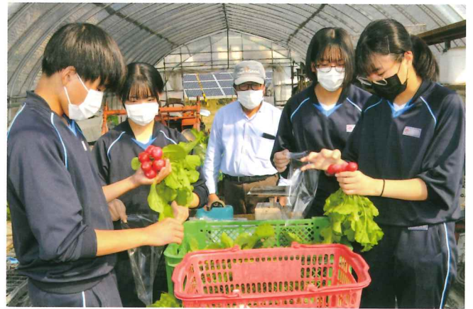
トライやる 野菜の袋詰め