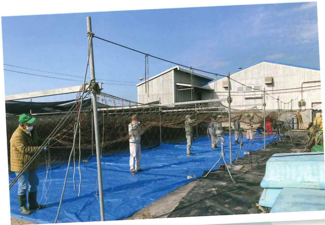
大濱海苔 海苔網の片づけ