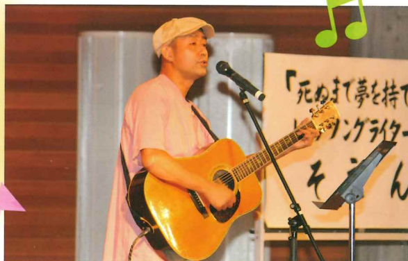
トークソングライターそえんじさん 音楽講演