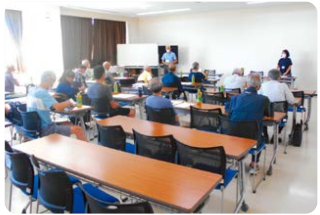
会員の意見・希望を反映させる為、年1回開催しています