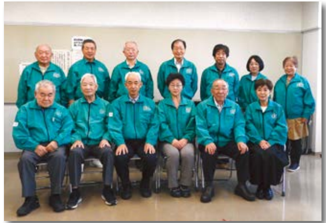
役員一同よろしく申し上げます