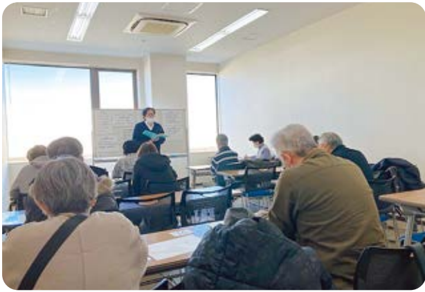
月2回開催しています