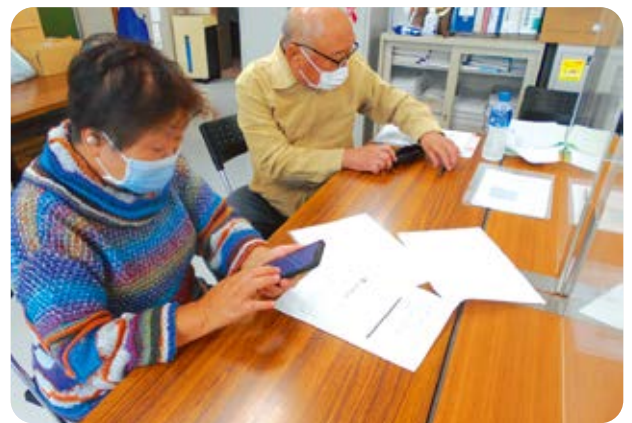
昨年導入した会員専用アプリ、スマイルツースマイルの操作をサポートしました