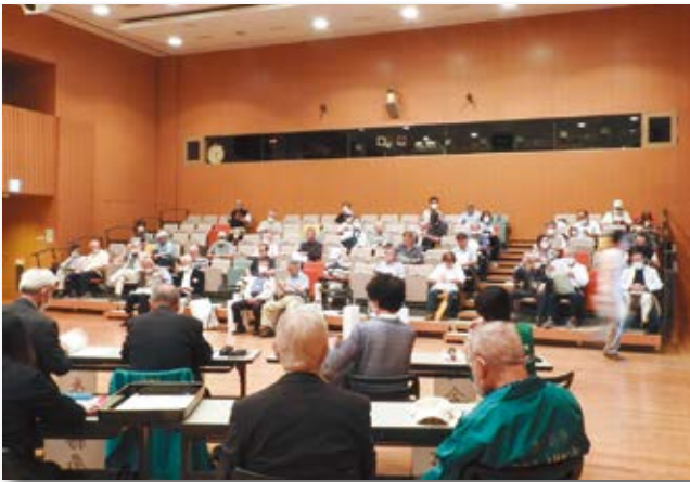
活発な意見交換がなされました