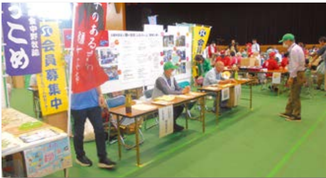
産業フェスティバル