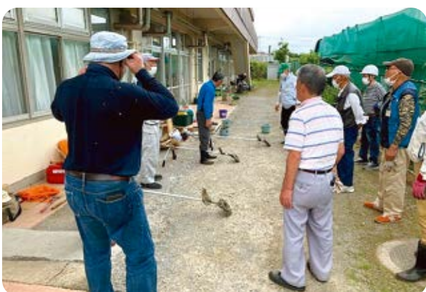
刈払機の使用法・手入れについて学びました