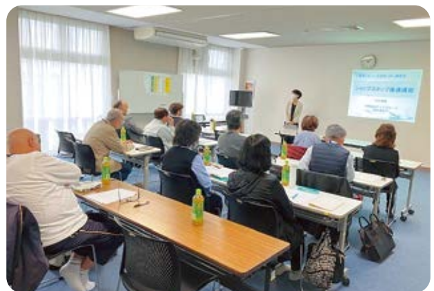
接遇とハラスメントについて学習しました