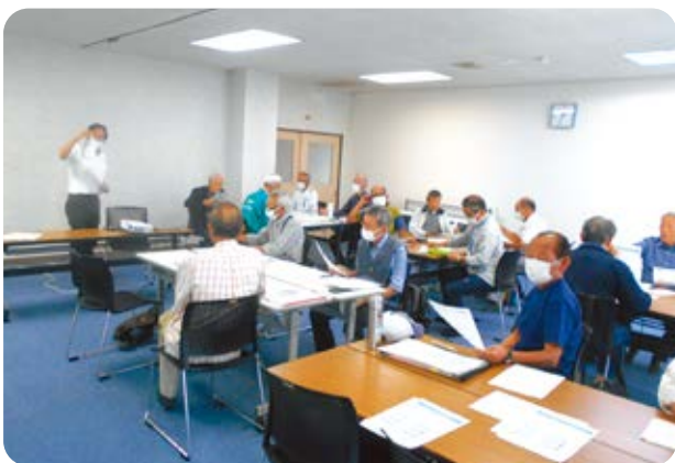
センターの円滑かつ活発な運営の為、年1回開催しています