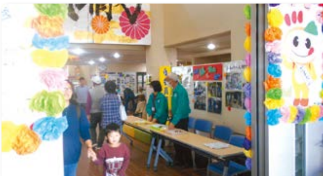
公民館ふれあいまつり