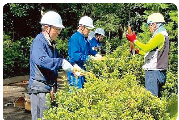
技能習得向上と後継者育成の為、年2回開催しています