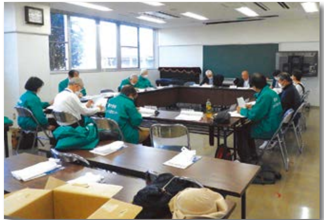
東初富公民館にて月一回開催しています

鎌ヶ谷市シルバー人材センターでは、昨年「デジタル推進委員会」を発足し、「スマホセミナー」や「スマホ相談室」を開催し皆さまのデジタル活用をサポートしています。同じ年代の仲間同士ですから、臆することなく相談できると思います。