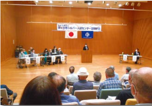
東部学習センターレインボーホールにて開催されました