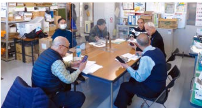
月一回デジタル推進委員会を開催しています