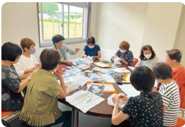
女性会員拡大と親睦を深める為、毎月活動しています