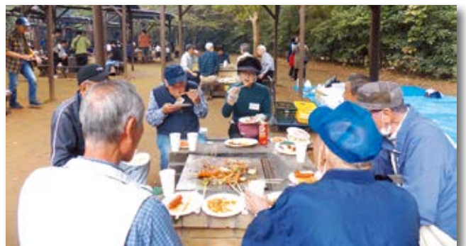
懇親会（バーベキュー）