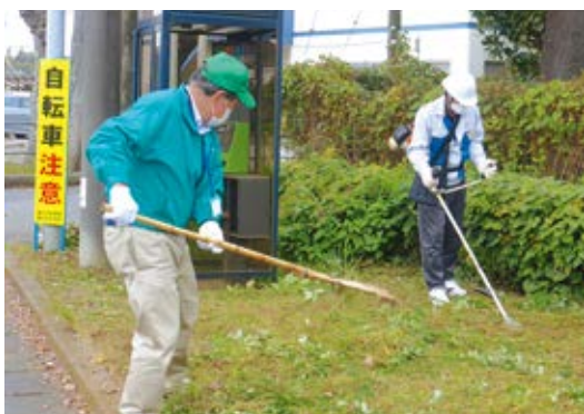
刈払機による除草実習