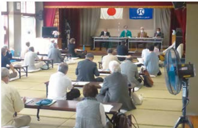
昨年も、新型コロナウイルス感染症の拡大防止に配慮し、スペースの確保対策のもとで開催致しました