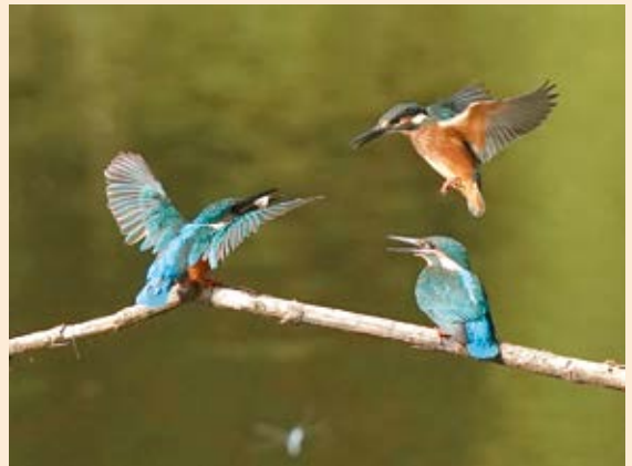
「カワセミの子育て」