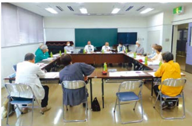
理事会運営規則により月一回開催しています