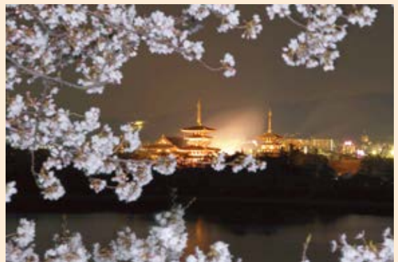
しょうおうやくしじ 「宵桜薬師寺」