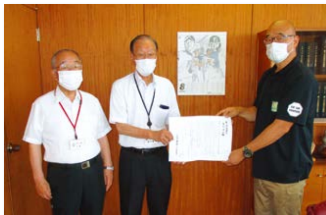
就業機会の拡充などを市長・議長に要請しました