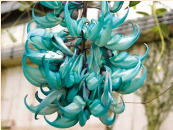
「ヒスイカズラ」(市川市動植物園) 星野 義一