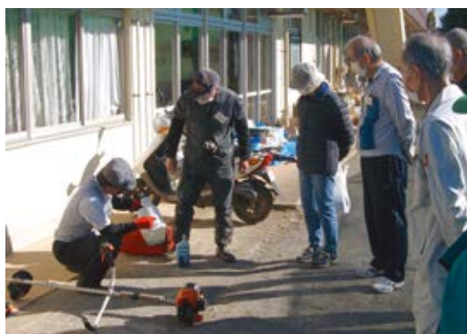
刈払機の燃料混合実習