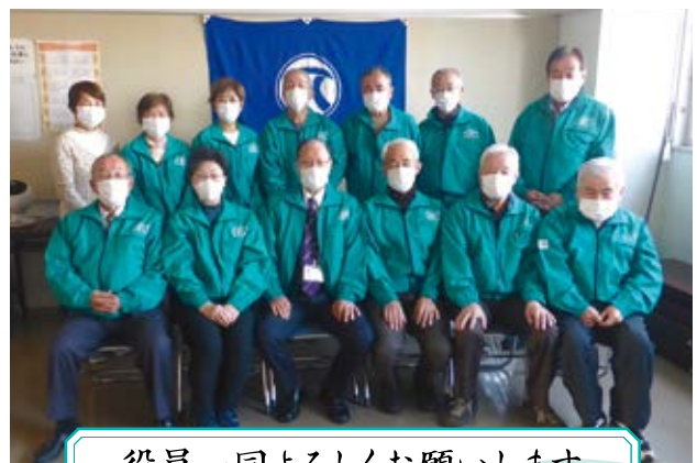
役員一同よろしくお願ひします