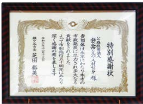
令和3年11月13日(土)、鎌ケ谷市市制50周年記念式典がきらり鎌ケ谷市民会館にて開催され、当センターは市制施行50周年特別感謝状を受けましたことをお伝えいたします。

鎌ケ谷シルバー便り（毎月十日発行）とシルバーかまがや（一月一日発行）の編集を行っています。 昨年は新型コロナウイルス感染症拡大防止の為、各イベントは中止となり広報活動などが出来ませんでした。