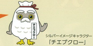
シルバーイメージキャラクター「チエブクロー」

シルバー人材センターでは仕事をする以外にも様々な活動を行っています。ここでは昨年の活動の一例をご紹介します。