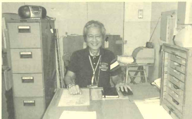
今日も笑顔で管理員業務に就業

この仕事に就いて、子供たちの元気な声を聴きながら施設利用団体の方々と言葉を交わすことや学校内を約一万歩歩くことで健康を保つことに大変役立っています。ますます若返ったように感じられます。