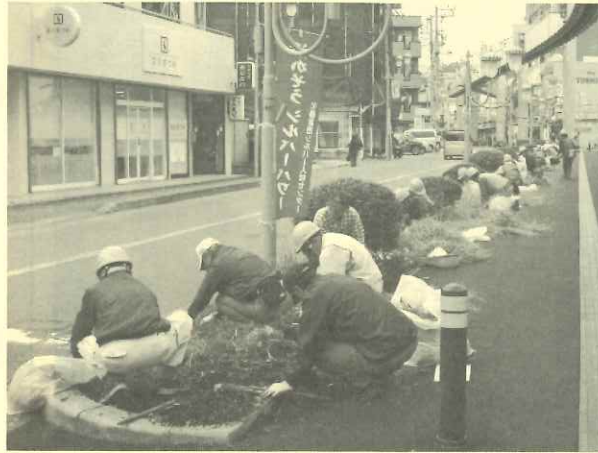
作業日及び作業場所

自分の所属する地域班の作業日に都合が悪い人は、他の地域班に参加することが出来ます。他の地域班での作業を希望される方は、自分の所属する地区班長まで連絡してください。皆さんの積極的な参加をお願いします。