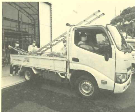
トラックに梯子などを載せて出発

紹介された仕事は運搬班でした。運搬班は、植木の手入れ作業や除草作業を行うためにその道具(梯子・脚立・ほうき・熊手等)などをシルバーセンター事務所からトラックでお客様のところまで運ぶとともに、作業終了後その道具と植木作業の枝や草などの残材を回収してその残材を関谷の植木剪定材受入事業場へ搬入する仕事です。 梯子や脚立をお客様のところへ搬入するときは、お客様のもの(車両や扉など)を破損しないように置き方を工夫した