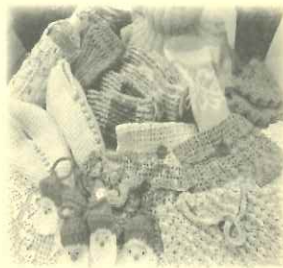
手袋・小物入れなど「あじさい趣味の会」の作品