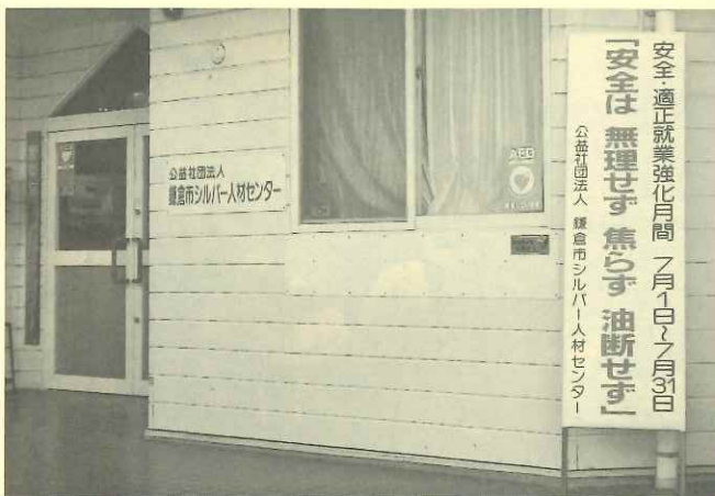
シルバーセンター事務所前に掲出された安全標語