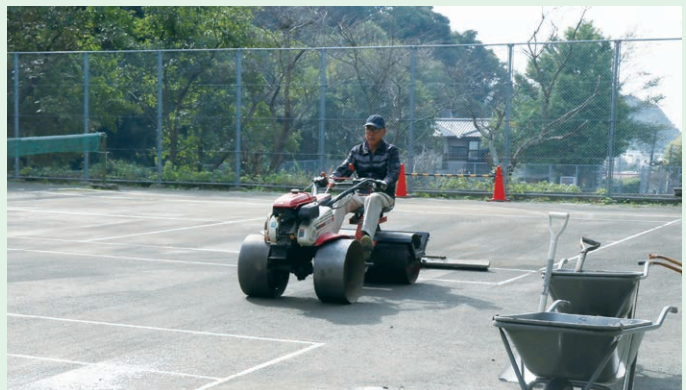
明日も気持ちよくプレーしていただくために

コート利用者は市民の高齢者が七割、若者三割や家族連れのほか、年七〜八回の鎌倉市と湘南地区中学大会、クラブ対抗などの団体戦、定期利用の国大付属などで、皆さんから「いいコートですね」と声をかけられると一気に疲れもふっ飛びます。