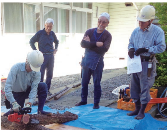
安全第一で取り組む参加者と指導係の方々

チェーンソーなどは扱いを間違えると大きな事故につながります。参加された方々は皆真剣な面持ちで望んでおられました。