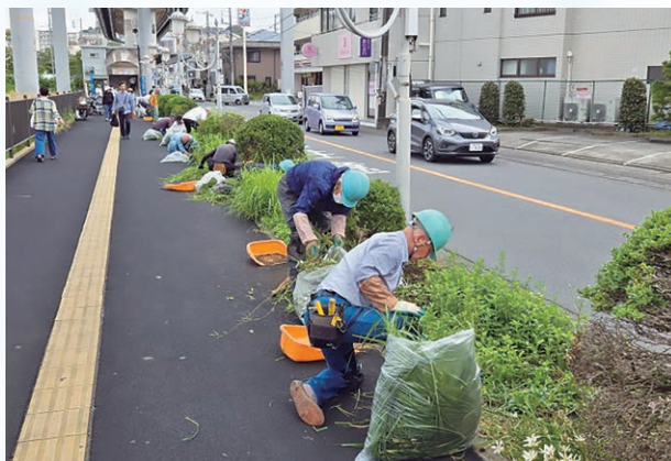
モノレール湘南深沢駅周辺除草作業

令和六年十月十日（木）は、JR大船駅西口の歩道の除草清掃を玉縄地区の会員十五名が行