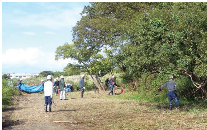
「石造 宝篋印塔」周辺除草作業

宝篋印塔は通称「泣塔」と呼ばれていますが、「泣塔」という名前の由来について詳しいことは分かっていません。塔の後ろのやぐらが風に反響して泣き声のような