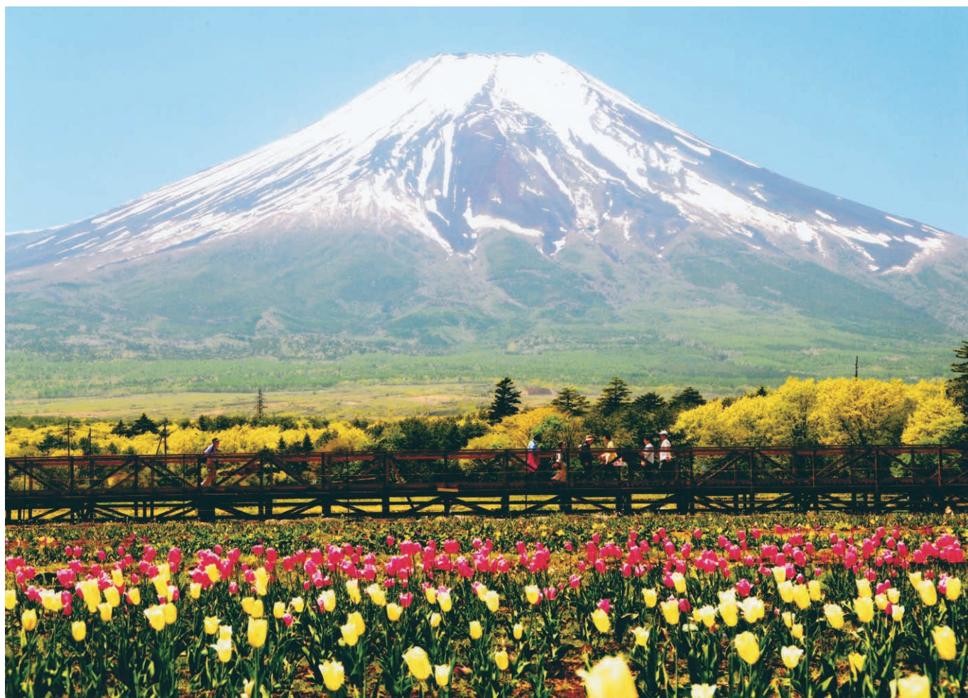
「富士 花の都公園」