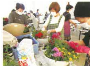
花の寄せ植え教室