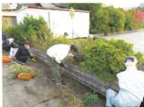
手むしり除草講習会