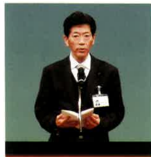
鳥倉経済局長 祝辞