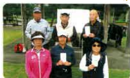
上位表彰のみなさん