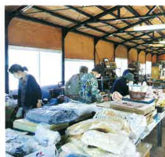
リサイクルショップ