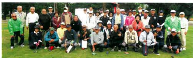
参加者・スタッフのみなさん