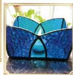
キャンドルスタンド

「孫守りから解放された時に、親友とこれまでにしてみたかった趣味にトライしてみました。楽しい思い出の詰まった作品です。」