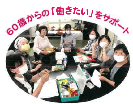
60歳からの「働きたい」をサポート

公益社団法人 金沢市シルバー人材センター 〒920-0051 金沢市二口町ニ24番地5 TEL 076-222-2411 FAX 076-224-0774 ホームページ https://webc.sjc.ne.jp/kanazawa/ メールアドレス kanazawa@sjc.ne.jp