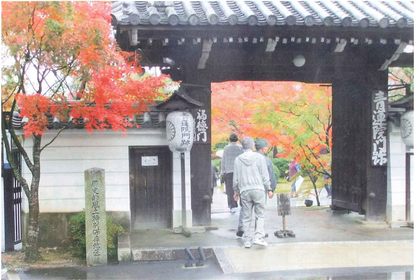
京都青蓮院飛び地境内 青龍殿・將軍塚

監事 監事 常務理事 理事 理事 理事 理事 理事 理事 理事 理事 理事 理事 理事 理事 副理事長 理事長 大原西 高橋 高中野 合野 石井 細川 中野 多賀 牧水 清西 小田 藤橋 高倉 大保 久谷 守賀 大田 富川 幸幸 幸泰 幸宗 繁 正 忠 勝利 正 幾 晴 哲弘 男良 利男 男男 司久 學宏 弘信 久夫 等 通 三 夫 司