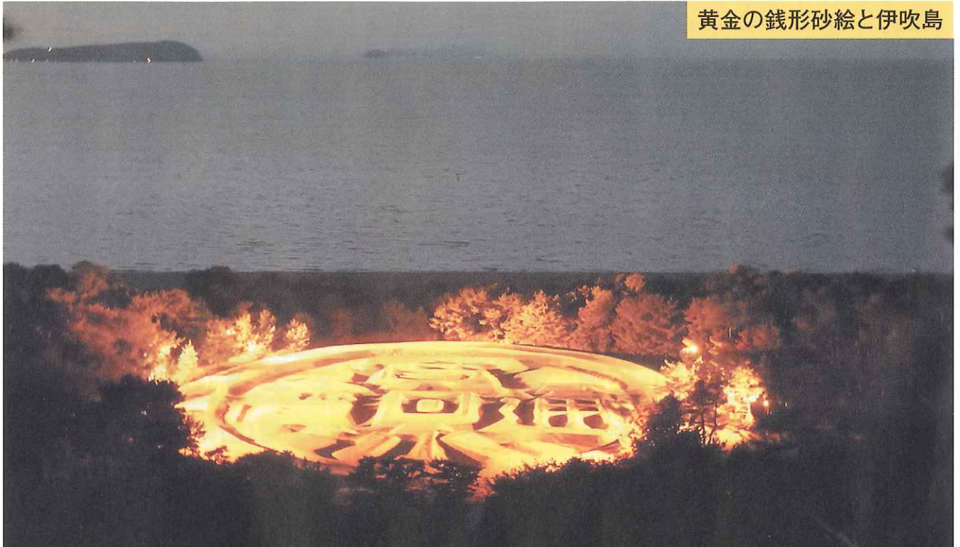
黄金の銭形砂絵と伊吹島

江戸時代から続く砂絵の一大芸術として長く保存されてきた銭形砂絵。当時からの通貨の形を模っている事からこの銭形を見た人は「健康で長生きできて金に不自由しなくなる」と言われ、金運のパワースポットとなっています。東西122m、南北90m、周囲345m！壮大な砂絵で、毎日、日没から午後10時まで点灯し、通常はグリーンですが、期間限定でゴールドやブルーにライトアップされます。