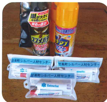
殺虫剤とポイズンリムーバー

業中は防虫ネットを着用、早期に巣を発見し薬剤で退治するなどしています。今年度から万一に備え、ポイズンリムーバー(刺された毒を吸い出す器具)を携帯し、応急処置ができるようにしています。しかし、気を付けるに越したことはありません。