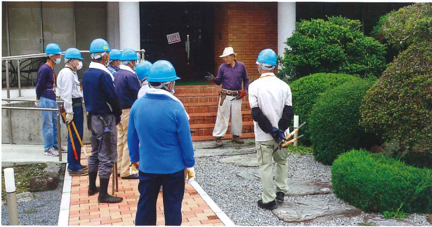
剪定の基礎を学ぶ受講生

甘楽町在住の受講生3名の方が終了し、会員に加入していただきました。活躍が期待されます。