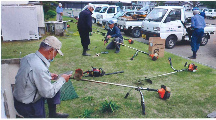
点検・整備は欠かせない

蜂による事故が毎年発生しており、蜂毒アレルギーの抗体の有無を知り、重篤事故の発生を防ぐこ