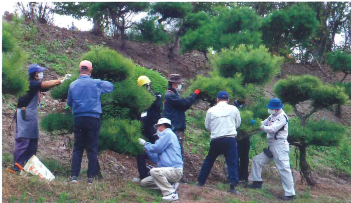
松の剪定作業を学ぶ

この事業は、シルバー人材センターでの就業を希望する未入会の高齢者、及び職種転換などを希望