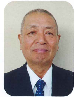
再選の落合理事長

役員は、任期満了に伴う改選が行われ、理事長の再選をはじめ次のとおり新役員が決まりました。引き続き会員互助会の総会の行われ、事業報告と事業計画が承認されました。