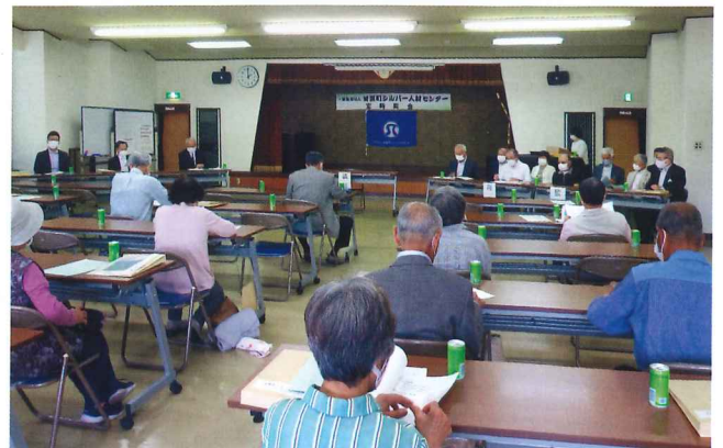
コロナ禍で間隔をとっての総会